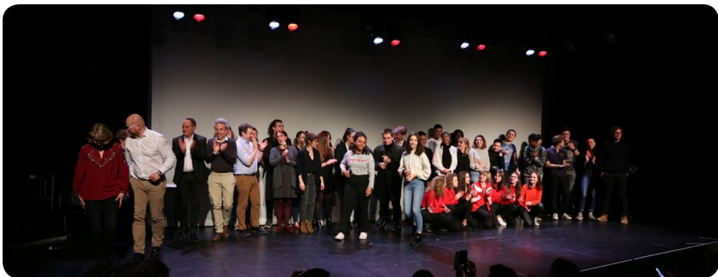
Soirée de remise de prix binôme academy - mars 2019

En partenariat avec la Faïencerie-Théâtre de Creil.