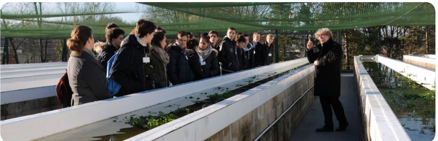
Visite de l'INERIS par les élèves du lycée Saint Vincent de Senlis - 9 décembre 2015.