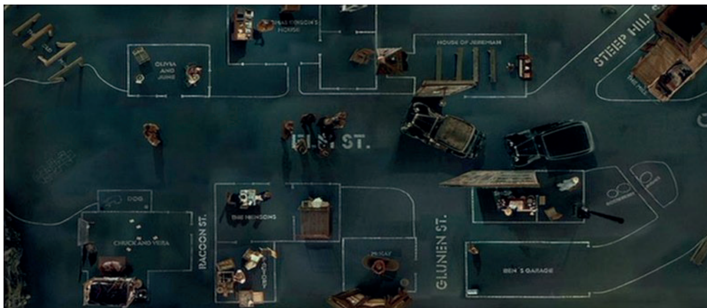
Décor de Dogville de Lars von Trier

La maison qui a été témoin de leur Amour est aujourd'hui le champ de cette ultime bataille avant l'oubli. Elle est le 7ème personnage de cette intrigue et est au coeur de la scénographie. A l'instar du film Dogville de Lars von Trier, les contours de la maison et de ses pièces sont dessinés en blanc sur un sol noir et quelques éléments de structure (portes, fenêtres, parties de cloisons...) et de mobilier définissent les espaces. Un grand miroir (écran en mirolège) suspendu en biais aux cintres donne une vue aérienne de cette maquette. Les personnages sont pris au piège dans cette boîte de pétri et sont tous alternativement observateurs et observés.